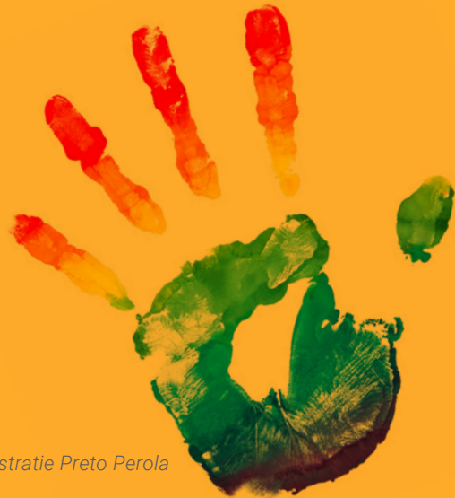
Regenbooghand: Illustratie Preto Perola

In 2015 inventariseerden onderzoekers van Kennisplatform Integratie & Samenleving 400 bronnen met sprekende verhalen van biculturele LHBT's in Nederland. Sprekend in de letterlijke zin van het woord: alle artikelen, bundels, boeken en interviews waarin zij zelf aan het woord komen over hun persoonlijke leven hebben we verzameld en naar culturele achtergrond gerangschikt. Het bijeengebrachte materiaal leverde een schat aan informatie op over patronen van zelfbeschikking en coming out, over handelingsperspectieven en spanningen. Vooral bij twintigers, want de meeste levensverhalen worden vanuit het perspectief van jongvolwassenen verteld. Deze levensfase is voor veel homo's en lesbo's in Nederland vormend van welke komaf ze ook zijn. Ook als ouderen vertellen, blikken zij vaak terug op deze periode.