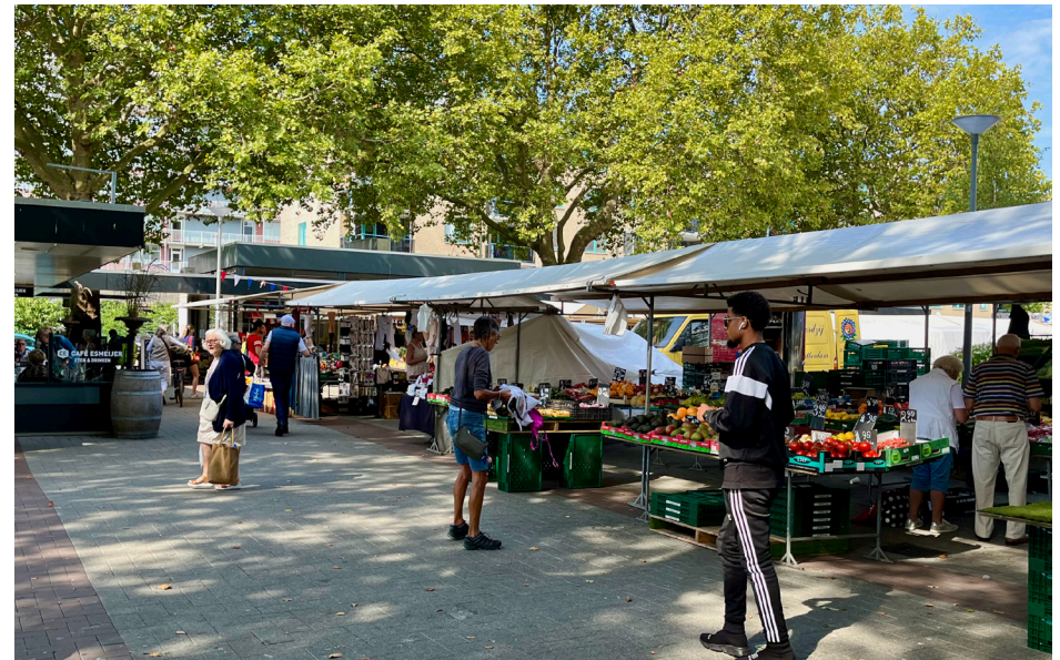
De markt in Prins Alexanderpolder

gebruikt, maar ze hebben niet de tropische producten die ik zoek. Ik ga wel naar de omliggende winkels, daar zit ook een Turkse supermarkt.'