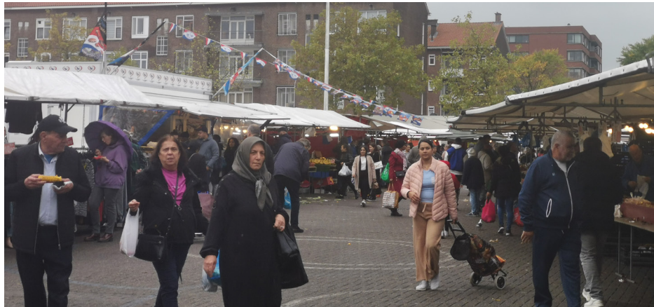
De markt op het Grote Visserijplein in Delfshaven

De markt is ruim opgezet op een groot plein dat uitkijkt op meerdere flats (ongeveer 10 hoog) en een groot multifunctioneel gebouw, met onder andere een bibliotheek en een Wmo-locatie. Op de Wmo-locatie bevindt zich ook een horecagelegenheid, waar koffie wordt geserveerd tegen de schappelijke prijs van 90 cent. Hier komen veel bezoekers van de markt aanwaaien; met name de oudere groepen blijven hier uren koffie en thee drinken.