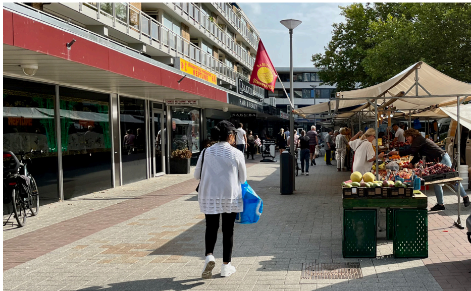
De markt in Alexanderpolder

Toch horen we ook een paar positieve geluiden. Een jongen geeft aan het bijvoorbeeld prettig te vinden dat er op de markt ruimte is om ‘gewoon te kijken’. Door het eerder genoemde verloop van de kraamhouders heeft hij geen vaste gezichten die hij hier iedere week ziet, maar dat lijkt hij niet erg te vinden. Hij vindt het verder passend voor de markt dat er weinig zitplekken zijn, omdat hij ziet dat op buurthuizen en andere multifunctionele gebouwen juist kliekvorming ontstaat door die zitruimte. Soms komt hij er vrienden uit de wijk tegen: ‘Je ziet hier altijd wel wat gebeuren. Ik kom hier vooral voor mijn boodschappen, maar als ik zin heb op mijn ogen uit te kijken, kom ik hier ook wel. Het is soms zo druk, dat het ook overweldigend kan worden.’