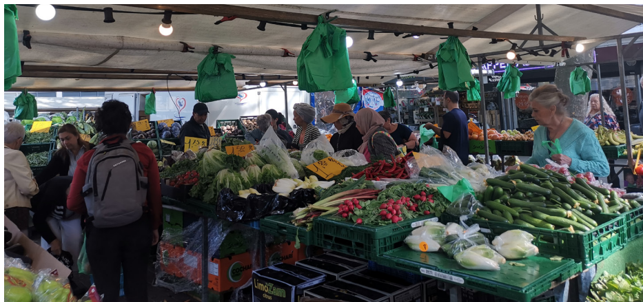
De markt in Prins Alexanderpolder

visboer, Turkse supermarkt, boekwinkel en Zeeman. Aan het plein bevinden zich verschillende horecagelegenheden met twee lunchrooms, een terras met koffie en een visboer met zitgelegenheid. De ruimtelijke inrichting van deze accommodatie verschilt van andere markten. Mensen kunnen snel een boodschap doen, daarbij opgaan in de anonieme massa, maar er is ook ruimte voor een praatje. Maar het ontwerp van de markt buiten de horecagelegenheid lijkt niet ingericht te zijn op ontmoeting: losse bankjes staan ver van elkaar en van elkaar afgedraaid, ook omdat ze buiten de loop om staan.