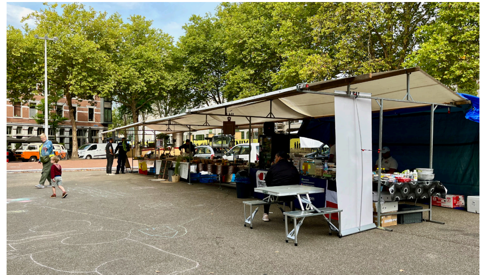
De Kaapse Markt in Katendrecht

Waar op de ene markt nog geen maatregelen zijn genomen om de ontmoetingsfunctie te versterken, is de nieuwe Kaapse Markt al van start gegaan. De Kaapse Markt bevindt zich in Katendrecht, een wijk waar ongeveer 50% van de inwoners een migratieachtergrond heeft, waaronder ook veel mensen met een Europese achtergrond. Voor de opzet van de Kaapse Markt is een adviescommissie opgesteld met inwoners en ondernemers uit de wijk.