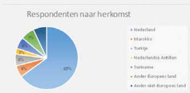
Figuur 1: Herkomst respondenten

Om de uitkomsten in perspectief te zetten is gestreefd naar een afspiegeling van de Nederlandse jeugd in leeftijd, gender, etnische en religieuze achtergrond, opleidingsniveau en woonplaats. De achtergronden van de jongeren die hebben deelgenomen aan het onderzoek lopen uiteen. De leeftijd van de respondenten ligt tussen de 12 en 23 jaar, waarvan 18 jaar de meest ingevulde leeftijd betreft. Differentiatie in geslacht is 55% vrouw tegenover 45% man. De respondenten die de enquête hebben ingevuld zijn zowel laag- als hoogopgeleide jongeren, zowel jongeren afkomstig uit de grootstedelijke context als uit middelgrote en kleinere steden in Nederland en jongeren met al dan niet een migratieachtergrond. Van 35% van de respondenten is een of beide ouders in een van de klassieke migratielanden of (nieuwe) EU-landen geboren, of zij zijn zelf buiten Nederland geboren. De respondenten die deelnamen aan de verdiepende interviews hebben een migratieachtergrond.