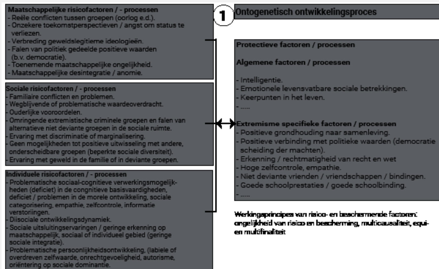
Figuur 2 Overzicht van risico- en beschermende factoren van radicalisering.

Het is niet echt aannemelijk dat onze ontwikkelingsgeschiedenis alleen gebaseerd is op de meer of minder sterke invloed van risicofactoren. In de ontwikkelingspsychologie ontwikkelt zich daarom al enige tijd een onderzoekstraditie die zich bezighoudt met het omgaan met negatieve invloeden in ontwikkeling. Gebleken is dat bepaalde factoren in staat zijn om risico-effecten (bijvoorbeeld een negatieve gezinsomgeving) te compenseren. Dit resultaat geldt voor alle ontwikkelingsgebeurtenissen en daarom ook voor radicaliseringsprocessen. Nu is er veel meer empirisch onderzoek gedaan naar risicofactoren dan naar beschermende factoren. Daarom is de stand van de kennis hierover tot nu toe zeer beperkt. Desalniettemin is het mogelijk gebleken om zowel algemeen beschermende factoren van de menselijke ontwikkeling (bijvoorbeeld intelligentie en emotionele steunbetuigingen) als beschermende factoren specifiek voor radicalisering (bijvoorbeeld binding met school en democratische waarden) te identificeren die de effecten van de genoemde risicofactoren in termen van individuele competenties of sociale middelen in evenwicht kunnen brengen (zie Lösel e.a., 2018).